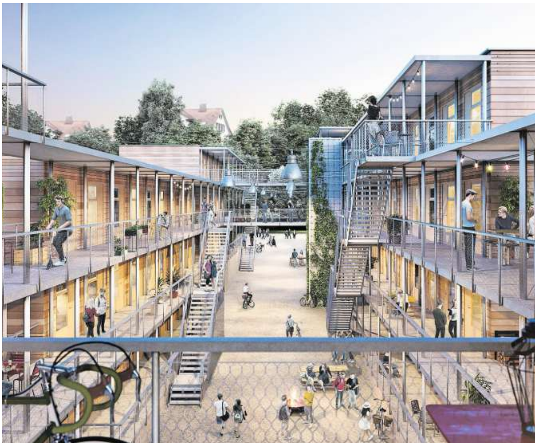
Ein Blick in die «Säbigasse» der geplanten Überbauung im Stadtsägeareal.

Die wichtigste Voraussetzung war, Platz für studentisches Wohn-